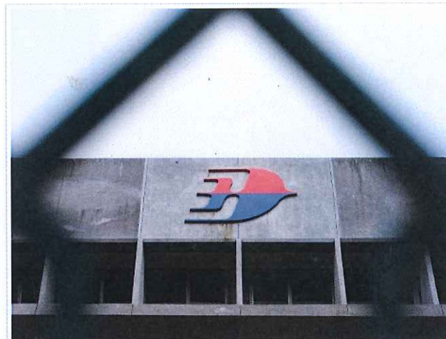
Pejabat Malaysia Airlines (MAS) Subang.

Cari, banding harga kereta dan dapatkan tawaran terbaik!