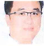
Ahli Parlimen sokong TH tidak jual tanah TRX

OpenSnap: Malaysia Dining Bookmark Your Favorite Dishes, Receive Personalized Pick, Try Now!